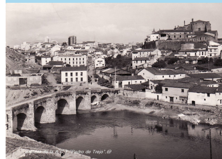
archivo de la A.C.T. "Padro de Trejo".@